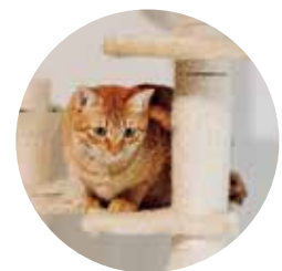
Family data ご夫婦＋ 猫3匹(きさご・ぼんず・カメレ)

今回、ヤマサハウスからの提案は、特殊加工した表面が硬い床材の採用、年代物の梁を活かした空間づくり。「床は、傷がつきにくくて汚れてもサッと拭くだけでOKなんです。それから、梁は猫たちのキャットウォークになりました」とお客様。解体工事の終了後に猫たちと見学へ行ったところ、猫が脚立から梁に登っているのを見て、高さの合うキャットタワーを用意することに。また、以前は、縁側や廊下などのスペースがあつて、ひとつひとつの部屋が狭かったのが、回遊動線になって広々としたこともあり、猫たちも走り回ってのびのびと遊んでいるのだとか。「まだまだたくさん猫を飼いたい」と話す、お客様の笑顔が印象的でした。