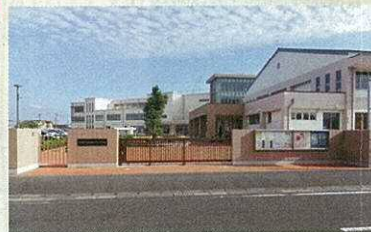
松原なぎさ小学校