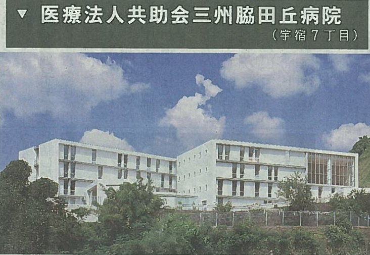
医療法人共助会三州脇田丘病院 (宇宿7丁目)